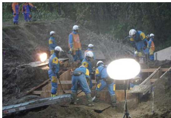
夜間における救出救助訓練