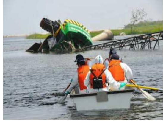
（福島県双葉郡浪江町）