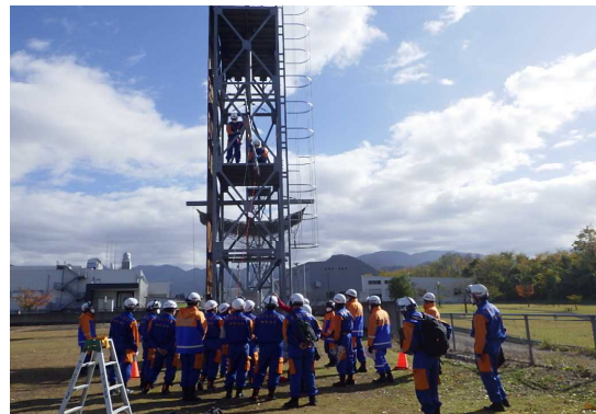
通信設備の高所作業訓練