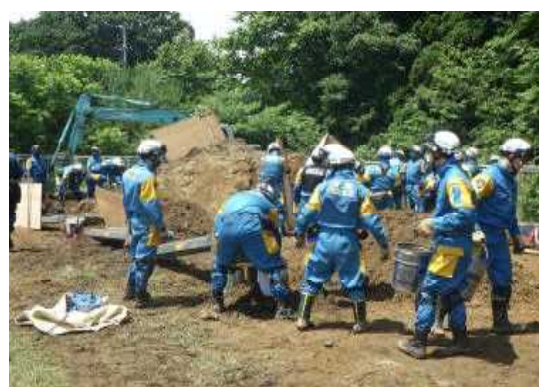
土砂埋没家屋からの救出救助訓練