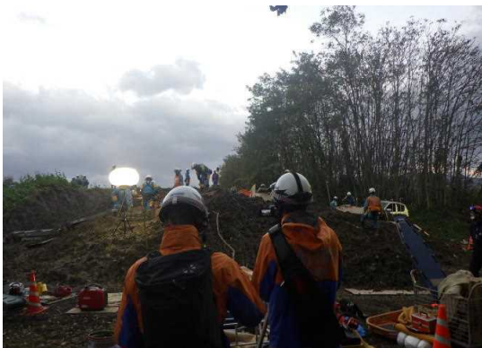
夜間における災害現場撮影訓練