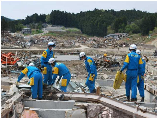
(宮城県本吉郡南三陸町)