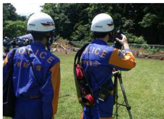
被災現場の映像配信訓練