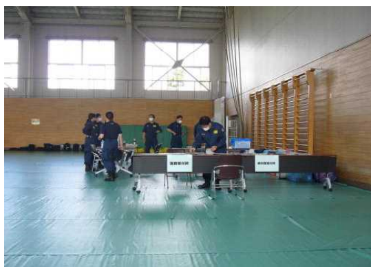
検視場所設営訓練