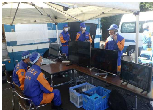
通信機器設営訓練