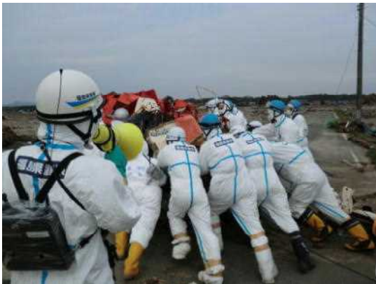
（福島県双葉郡双葉町）