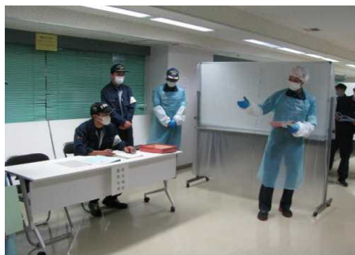
行方不明者相談対応に関する教養