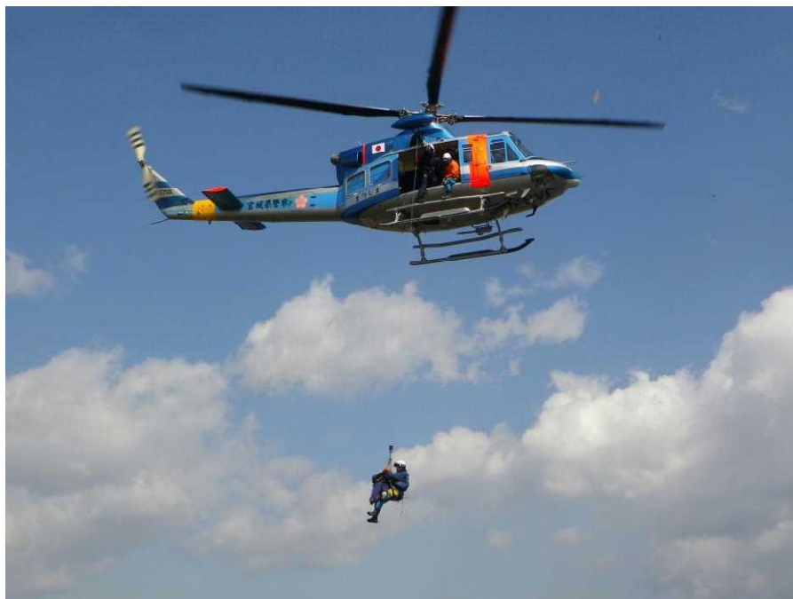
(宮城県仙台市若林区)