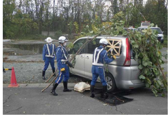
事故車両からの救出救助訓練