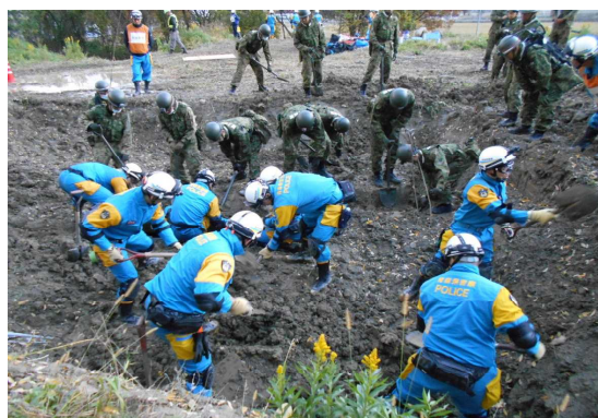
自衛隊と合同での救出救助訓練