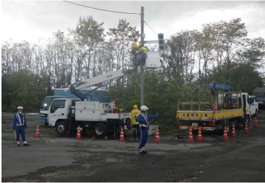
被災地での交通整理訓練