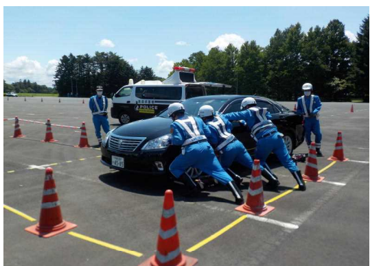
緊急交通路の確保訓練