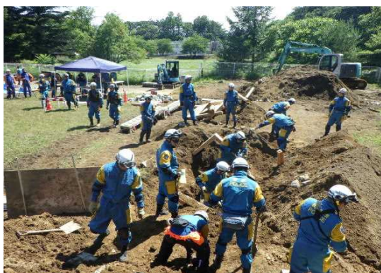
土砂埋没家屋からの救出救助訓練