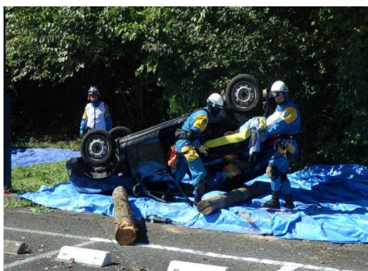
転落車両からの救出救助訓練