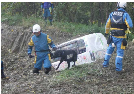
災害救助犬による捜索訓練