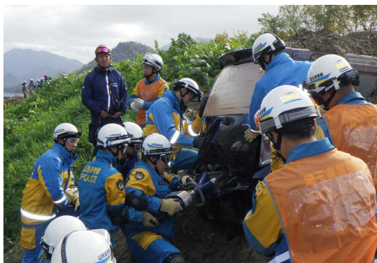
土砂埋没車両からの救出救助訓練