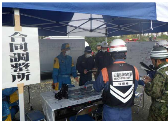
他機関との活動調整訓練