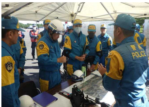
救出救助部隊現地指揮本部運営訓練

東北管区警察局では、宮城県警察との共催により、宮城県総合運動公園グランディ・21を会場に、宮城県、山形県、福島県の各県警察広域緊急援助隊による南部三県合同訓練を実施しました。