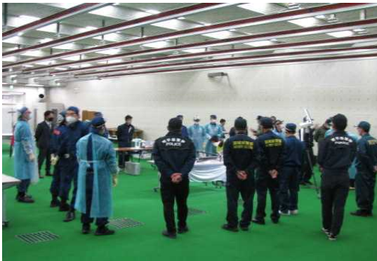
多数御遺体に対する身元確認訓練