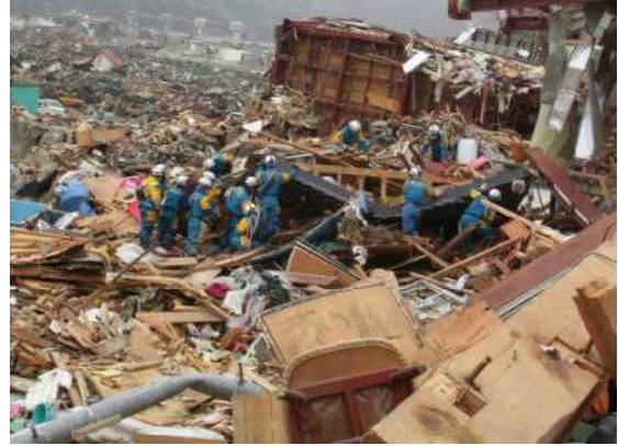
（岩手県上閉伊郡大槌町）