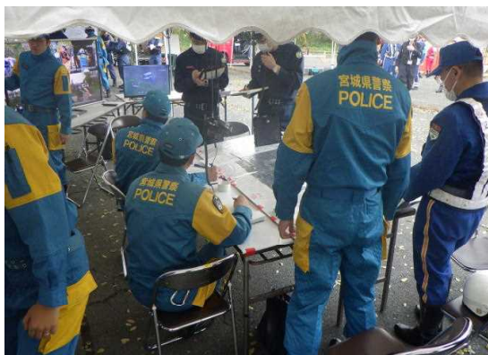
救出救助部隊現地指揮本部運営訓練

東北管区警察局では、山形県警察との共催により、大規模災害の発生に備えて、広域緊急援助隊の救出救助能力の向上及び関係機関との連携強化を図ることを目的として、山形県警察三隊合同庁舎を主会場に、東北管内の6県警察と北海道警察による広域緊急援助隊合同訓練を実施しました。