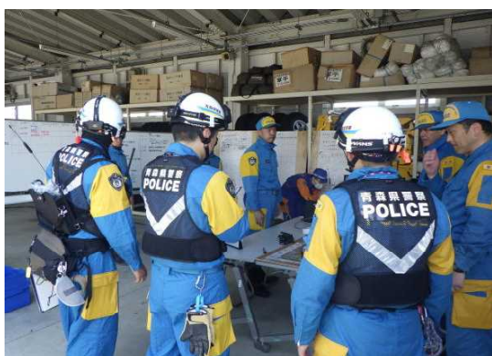
救出救助部隊現地指揮本部運営訓練

東北管区警察局では、岩手県警察との共催により、岩手県警察機動隊庁舎を主会場に、青森県、岩手県、秋田県の各県警察広域緊急援助隊による北部三県合同訓練を実施しました。